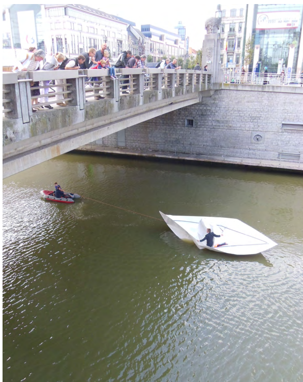
↑ Artistieke interventie, Festival Kanal

Cultuur en deelname aan cultuur verenigt mensen, zeker op wijkniveau. Momenteel lopen er meer dan 100 publieke en privé projecten in Brussel, die zowel de stedelijke morfologie van de wijken als de bevolking zullen veranderen. In dit opzicht verdient cultuur des te meer aandacht en dient men de integratie ervan te voorzien in de huidige en toekomstige programma's voor stadsontwikkeling.