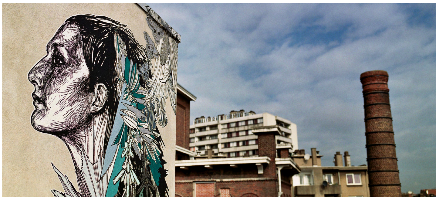
Graffiti terras Mima