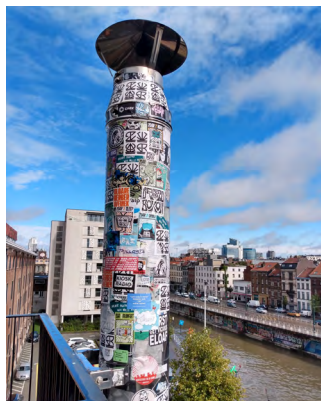
↑ Culturele communicatie Tijdelijk ◦ ULiège