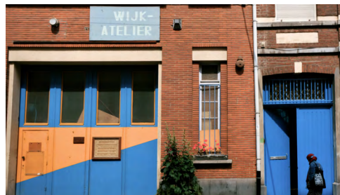
↑ Wijkatelier 2019 Sint-Jans-Molenbeek

Het kwalitatieve onderzoek onderstreept het belang van creatieve mogelijkheden in de wijken als alternatief voor een passieve culturele ervaring. Eerder dan culturele consumptie wordt er vertrouwd op de kracht van culturele co-constructie. Op die manier is het aan de mensen zelf -het gaat hier over een breed palet aan sociaal-culturele profielen- om deel te nemen aan de opbouw van de voorgestelde culturele inhoud, alsook het op gang brengen van solidariteitsprocessen in de wijk en de ontplooiing van burgerschap.