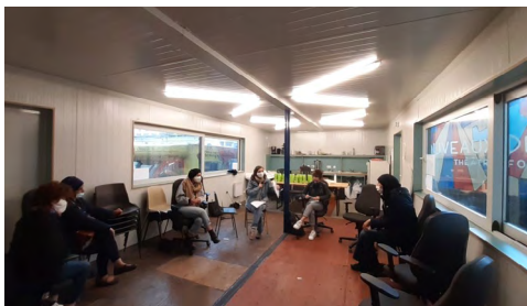
↑ Workshop 2020 Molenwest

>> Amateurkunstenaars zijn (meestal) vrouwen, hoogopgeleid en jong. Creatieve participatie is niet afhankelijk van iemands etnische afkomst of economische situatie. De meeste amateurkunstenaars beoefenen hun hobby in en rond het huis waar ze wonen, binnen en buiten het netwerk van familieleden en kennissen. Slechts een minderheid wordt bij de beoefening van hun hobby ondersteund door een club, academie of andere organisatie.