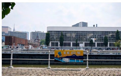
↑ Citroën kanaal