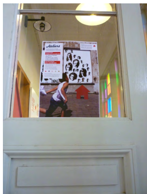
↑ Culturele communicatie ◦ ULiège

Tegelijkertijd bracht de analyse een vraag naar veiligere en meer toegankelijke ruimtes aan het licht, vooral voor jongeren.