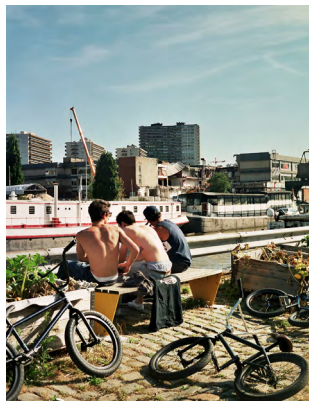
↑ Jongeren op de Materialenkaai

"Voor jongeren zijn er niet genoeg parken en activiteiten meer en dat is echt een grote bron van zorgen."