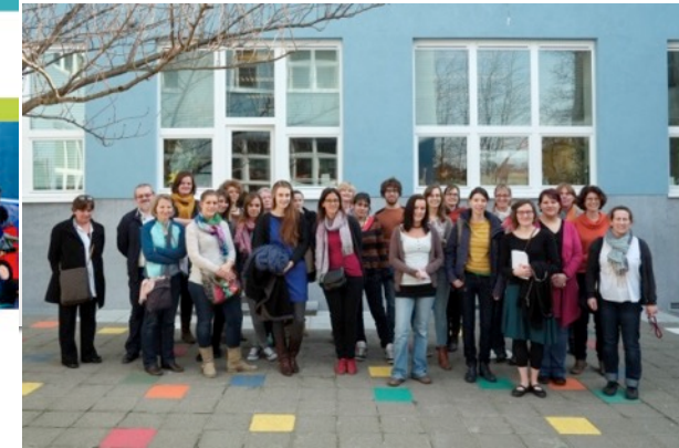
Des formations et visites d'écoles