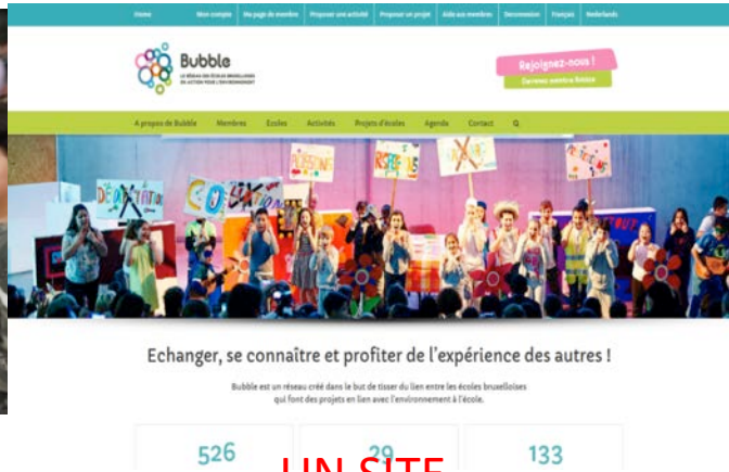
UN SITE WWW.BUBBLE.BRUSSELS PROJETS, AGENDA